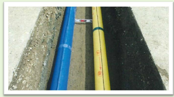
右側（黄色） ガス用ポリエチレン管 左側（青色） 水道用ポリエチレン管