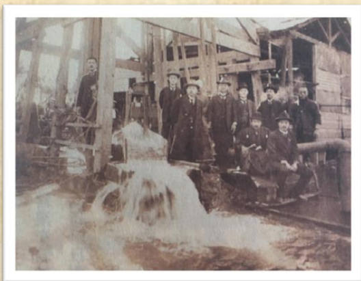
水道工事（第一水源地）

その後、大正9年に再開され、大正15年6月2日に地下水を水源とする第一水源地（現在の南城町4丁目）と第二水源地（現在の南城町1丁目）が完成し、825戸へ給水を開始しました。計画から給水まで実に15年の歳月を要しました。