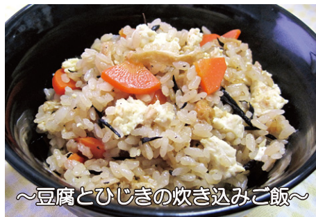
～豆腐とひじきの炊き込みご飯～

炊飯ボタン を押すだけで、あとは自動で火力調節。ガス火ならではのふっくら、つやつやの美味しいご飯が炊けます!