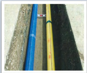
右側（黄色） ガス用ポリエチレン管 左側（青色） 水道用ポリエチレン管

ガス水道局では、地震に強い管（耐震管）への入替を進めています。工事中は交通規制等でご迷惑をお掛けしますが、ご理解とご協力をお願いします。