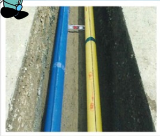
右(黄色)：ガス用ポリエチレン管 左(青色)：水道用ポリエチレン管