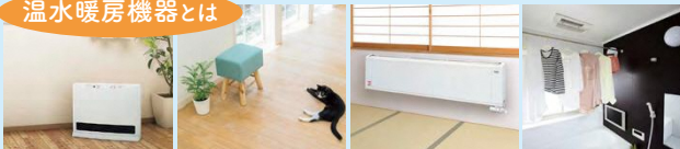
ルームヒーター 床暖房 パネルヒーター 浴室暖房乾燥機など