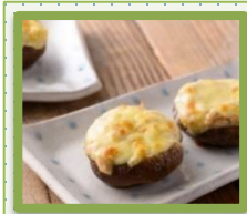
しいたけの ツナマヨ チーズ焼き (ココットプレート使用)