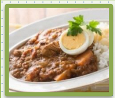
トマトたっぷり 無水カレー (ザ・ココット使用)