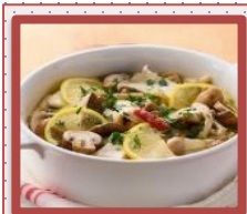
きのこの レモンマリネ (フライパン使用)