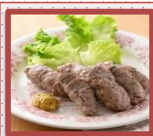
手作り皮なし ソーセージ (ココットプレート使用)