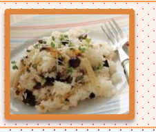
きのこの ピラフ くるみ風味 (炊飯鍋使用)