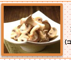
きのこの ホイル焼き (ココットプレート使用)