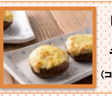
しいたけの ツナマヨ チーズ焼き (ココットプレート使用)