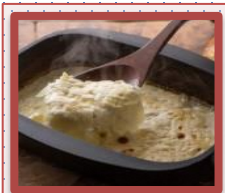
ドフィンワ ～じゃがいも のグラタン～ (ザ・ココット使用)