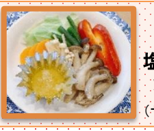
蒸し野菜と きのこの 塩麴パーニヤ カウダ添え (ザ・ココット使用)