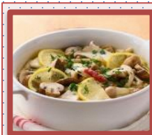
きのこの レモンマリネ (フライパン使用)