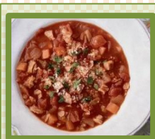
具だくさん ミネストローネ