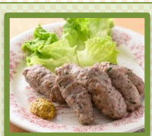
手作り 皮なしソーセージ