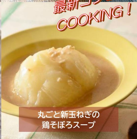
丸ごと新玉ねぎの 鶏そぼろスープ