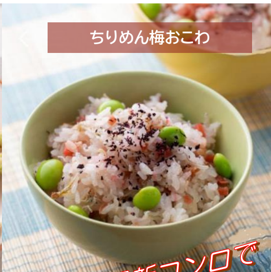
ちりめん梅おこわ