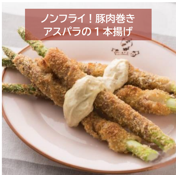
ノンフライ! 豚肉巻き アスパラの1本揚げ