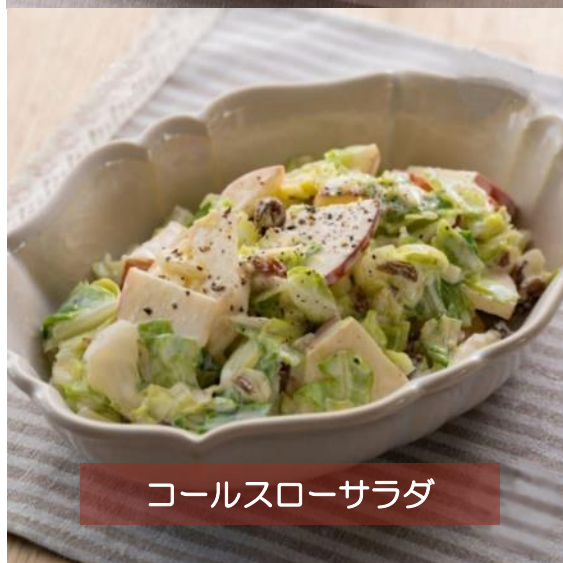
コールスローサラダ