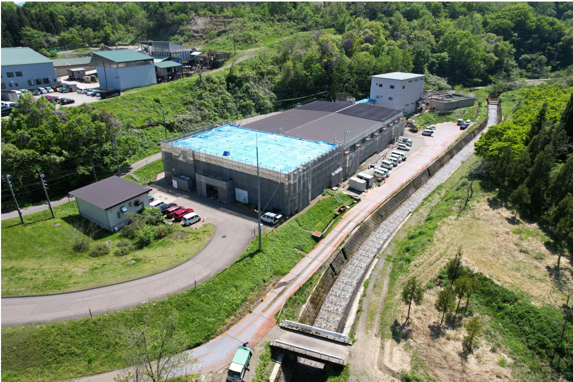
城山浄水場 大規模改修事業（令和5年度～令和7年度）