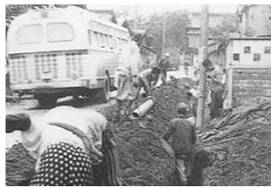
配水管布設工事の様子 (八千浦地区) 昭和36年頃