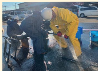
水道本管漏水止水訓練