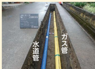
地震に強い耐震管への入替