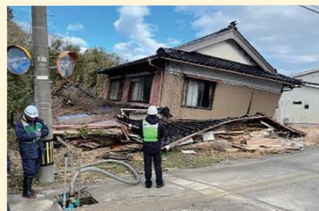
令和6年能登半島地震 災害派遣