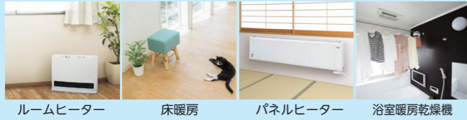
ルームヒーター 床暖房 パネルヒーター 浴室暖房乾燥機