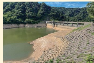
正善寺ダム (最低貯水率9.9% 8月6日)

令和7年は、城山浄水場上流に位置する新潟県営高田発電所の水圧管路の破断事故や記録的な少雨の影響により、上越市が渇水に見舞われました。市民の皆さまには節水にご協力いただきありがとうございました。