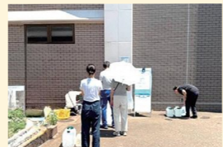
節水対象区域外 給水スポット