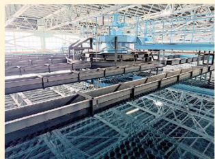
城山浄水場大規模改修事業

重要なライフラインである水道とガスをいつでも安定して供給できるよう、施設の更新や耐震管への入れ替え、職員の人材育成を計画的に行っています。