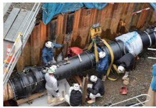
城山浄水場大規模改修工事の様子 令和7年