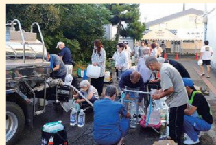
令和4年静岡市 台風15号災害 給水支援

災害によって市内外で水道が使えなくなった場合に備えて給水車を配備し、緊急時の給水体制と相互の協力体制を整えています。