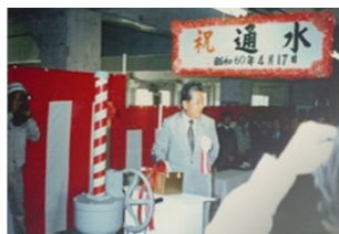
企業団第一浄水場通水式 昭和60年